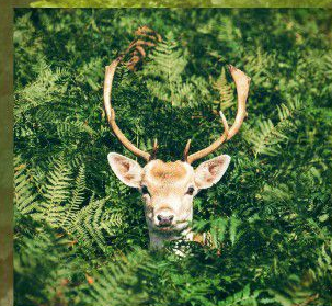
鹿角キーホルダー