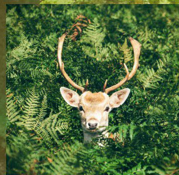
鹿角キーホルダー