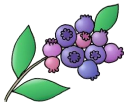
ブルーベリー取り