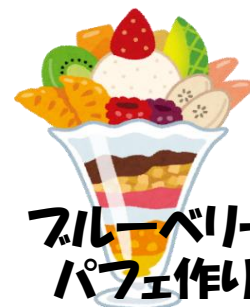
ブルーベリー パフェ作り